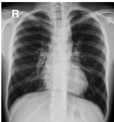
Fot.1. Zdjęcie wielkości serca w klatce piersiowej