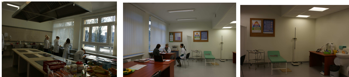
Fot.4, 5, 6. Pracownia Technologii Potraw i Pracownia Oceny Stanu Odżywienia

W roku 2011 planowane jest uruchomienie Pracowni Planowania Żywnienia wyposażonej w stanowiska komputerowe, oraz profesjonalne programy żywieniowe: Dieta 4.0, Energia, Wikt.