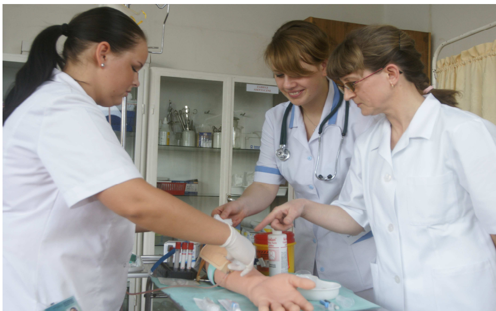
Zajęcia w pracowni umiejętności pielęgniarskich.