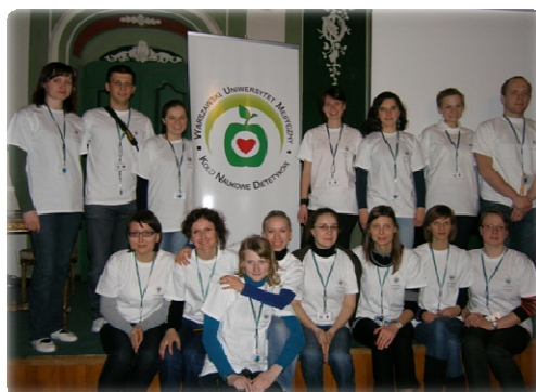
Fot 8. Obóz naukowy w Nałęczowie

W roku 2009 SKN Dietetyków zorganizowało pierwszy obóz naukowy w Nałęczowie. Podczas pobytu w uzdrowisku realizowali założenia autorskiego programu pt.: „ Twoje zdrowie w Twoich rękach ”.