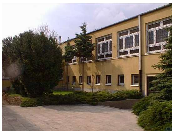
Fot. 1 i 2. Budynek przy ul. Erazma Ciołka 27, gdzie mieszczą się zakład: Żywienia Człowieka, Podstaw Pielęgniarstwa, Pielęgniarstwa Społecznego i Zakład Pielęgniarstwa Klinicznego