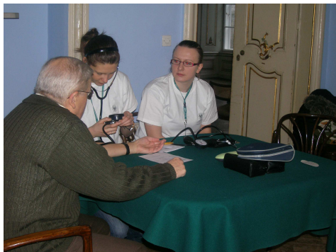
Fot. 4. Studentki z sekcji chorób metabolicznych podczas przeprowadzania wywiadu żywieniowego z pomiarem ciśnienia tętniczego